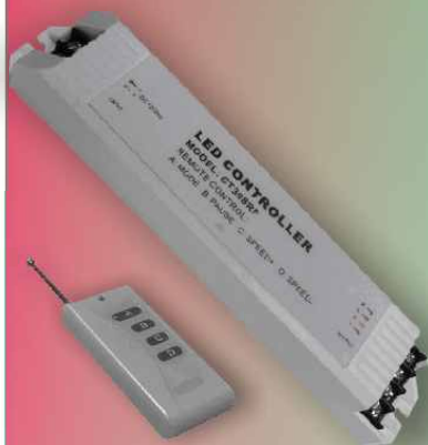
PCT-308-RF (211*40*30 mm)