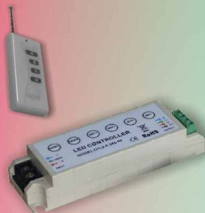
PCT3-5-360-RF (130*40*30 mm)